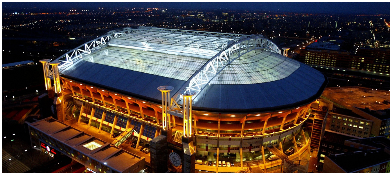
Johan Cruyff Arena, Paesi Bassi, le lastre LEXAN™ THERMOCLEAR™ sono installate dal 1995, ormai da 28 anni!